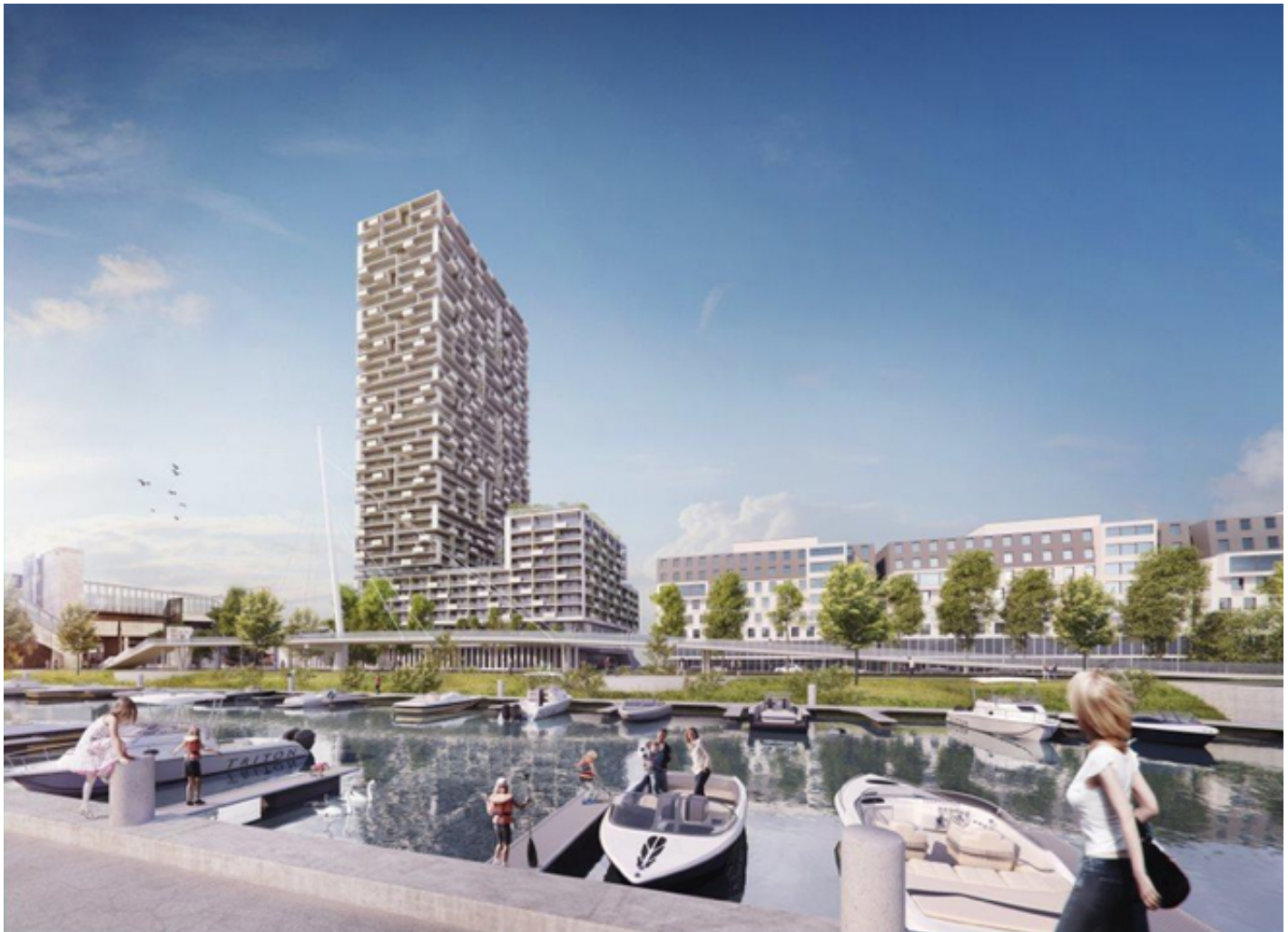
Der MARINA TOWER wurde mit dem ÖGNI-Nachhaltigkeitszertifikat in Gold ausgezeichnet.

nachhaltigen Mobilitätskonzepts angedacht, außerdem wird mittels Überplattung das rechte Donauufer erschlossen, was zum eine großzügige öffentliche Freiflächen eröffnet und darüber hinaus einen wichtigen Beitrag zur Stadtentwicklung leistet.